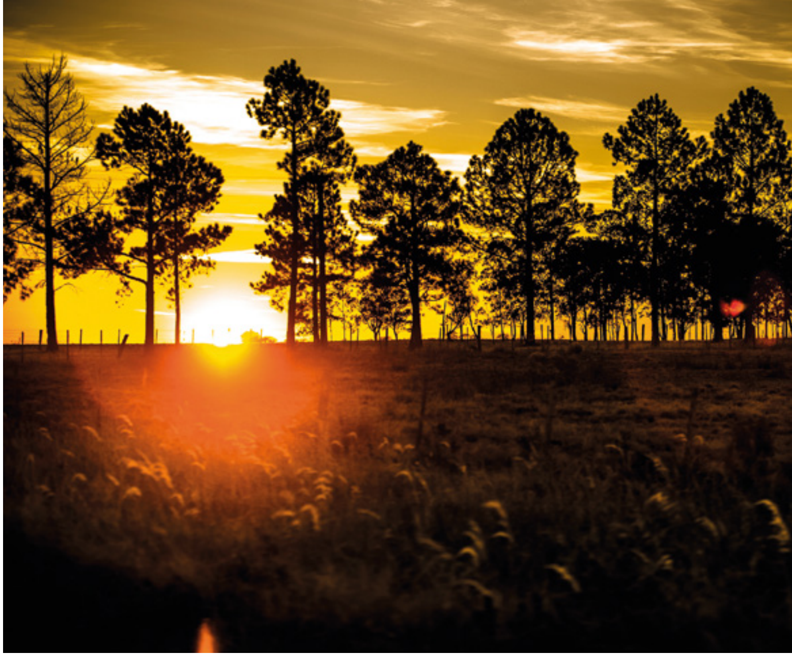
Fotografia: Rally da Pecuária, Giovane Rocha