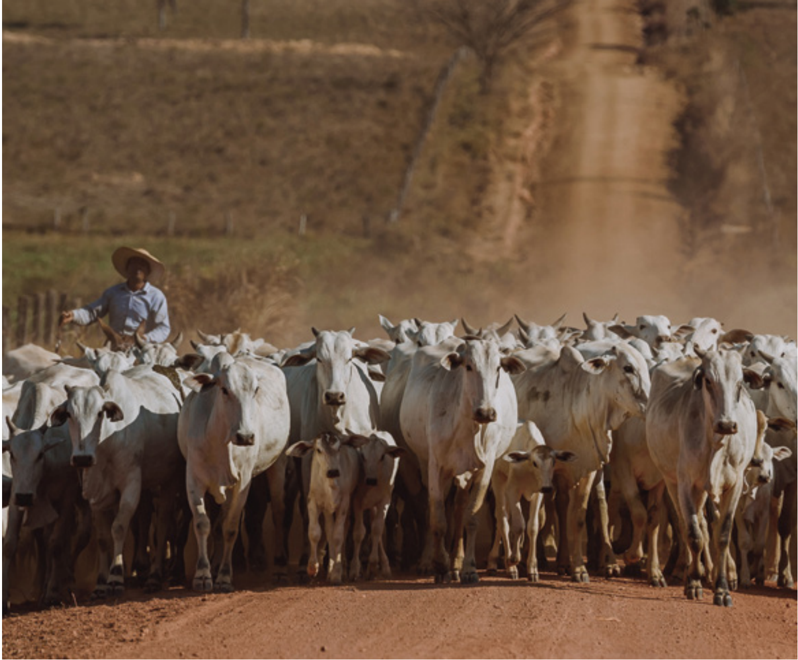
Fotografia: Rally da Pecuária, Alécio Cezar