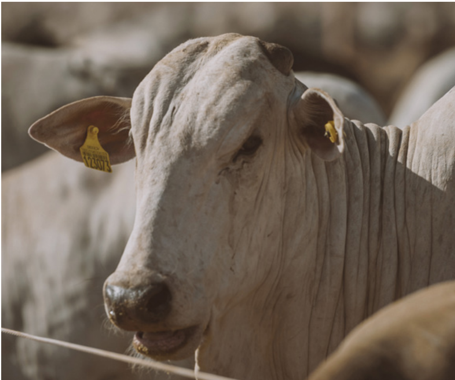
Fotografia: Rally da Pecuária, Alécio Cezar