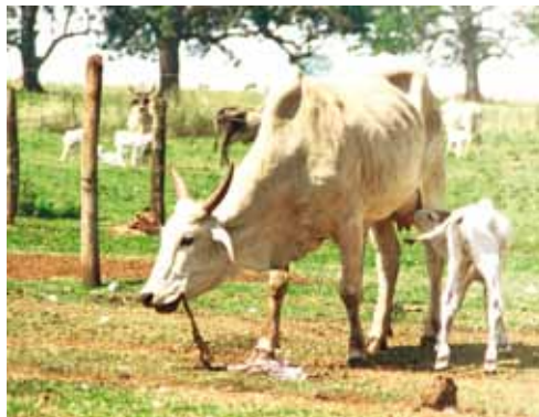
VACA COMENDO PLACENTA

Vacas muito gordas ou muito magras apresentam maior risco de problemas de parto; as gordas por apresentarem contrações mais fracas e as magras podem não terem a energia necessária para o trabalho de parto.