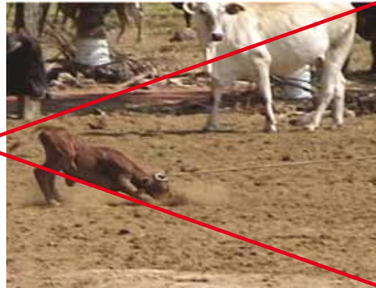
EVITE MANEJAR OS BEZERROS DE FORMA AGRESSIVA

Outro vaqueiro deve permanecer atento, não permitindo a aproximação da vaca em direção ao companheiro, até que ele esteja sobre o cavalo novamente.