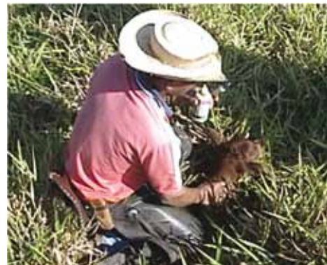
CUIDANDO DO BEZERRO NO LOCAL DO NASCIMENTO