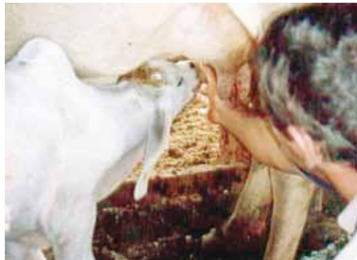
AUXÍLIO PARA MAMAR