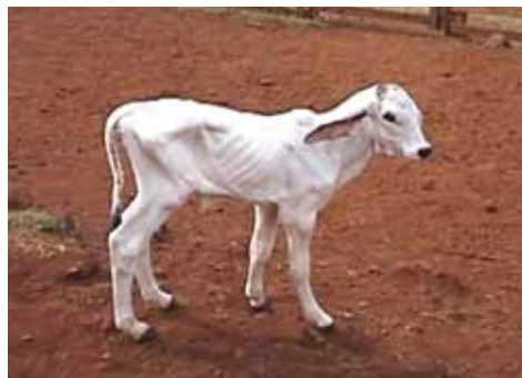
BEZERRO COM O VAZIO FUNDO, INDICATIVO DE FALHA NA PRIMEIRA MAMADA