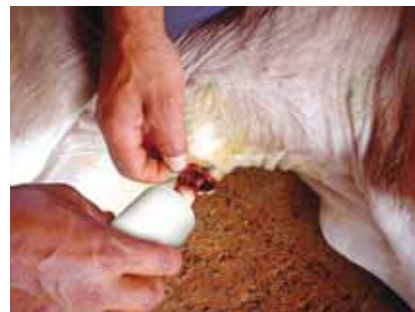
ASSEPSIA DO UMBIGO

É recomendado pesar os bezerros no dia seguinte ao nascimento. O ideal é usar balanças portáteis para que possam ser levadas ao pasto-maternidade. Caso não haja disponibilidade de balança na fazenda pode-se avaliar o peso dos bezerros considerando três categorias: leve, médio e pesado.