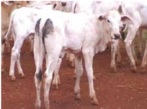
BEZERRO COM DIARREIA

A par dessas informações, buscamos os motivos para tais perdas, que ocorrem principalmente quando há dificuldades no parto, baixo vigor dos bezerros e cuidados maternos deficientes. Estes problemas são mais comuns quando os bezerros são muito pequenos ou muito grandes. Há ainda a possibilidade de ocorrer acidentes com os bezerros, que podem ser minimizados evitando-se situações que colocam suas vidas em risco. Por exemplo, devemos evitar pastos maternidades pequenos, com alta densidade, com buracos e com curvas de nível profundas, que acumulem água.