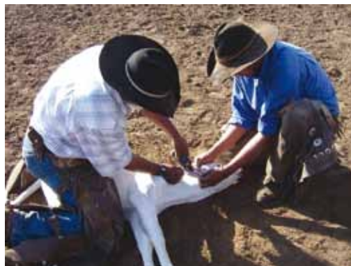
BEZERRO CONTIDO COM EFICIÊNCIA

Não jogue o bezerro no chão , levante-o um pouco do solo e utilize sua perna como apoio para descê-lo ao chão. A contenção para manter o bezerro deitado deve ser feita sem força exagerada.