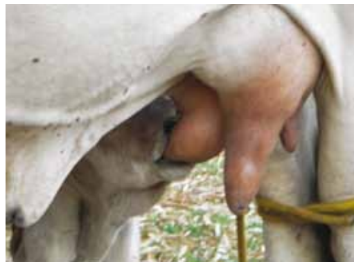
AJUDANDO O BEZERRO A MAMAR