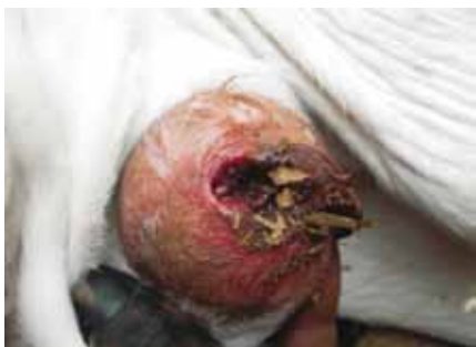
UMBIGO COM BICHEIRA

Em casos específicos, como os de bezerros com umbigos inflamados e bezerros muito fracos, pode ser aconselhável a utilização de antibióticos, que devem ser recomendados pelo veterinário responsável.