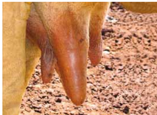
TETO NÃO MAMADO

Nos casos em que ocorrer abandono ou troca de bezerros deve-se aproximar a mãe de seu filho, mantendo-os juntos em local tranquilo para que possam formar os laços materno-filiais.