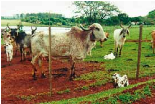
BEZERRO DO OUTRO LADO DA CERCA

Os estímulos externos podem prejudicar o reconhecimento entre mãe e filhote. Sabemos que em áreas com muito movimento as vacas geralmente interrompem o contato com o bezerro, deixando de cuidar da cria para ficar em vigilância. Com isto, há um aumento no tempo que os bezerros levam para se levantar e mamar.