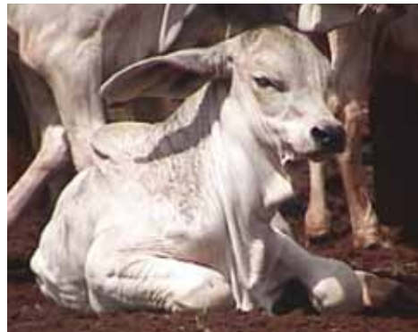
BEZERROS EM BOAS CONDIÇÕES, INDICATIVO DE VIGOR ADEQUADO