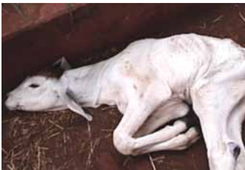
BEZERRO PROSTRADO, INDICATIVO DE BAIXO VIGOR